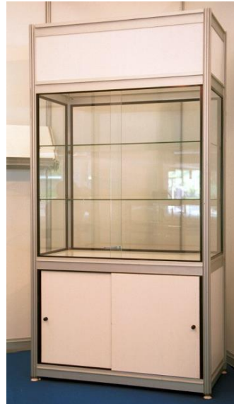
Vitrina 38,00€ unidad