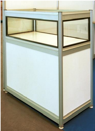
Mostrador 28,00€ unidad