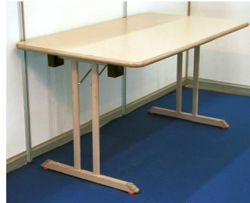
Mesa 14,50€ unidad