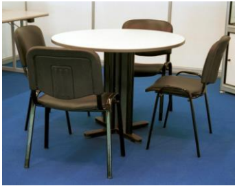
Silla de polipiel 4,50€ unidad

Los precios incluyen el alquiler para toda la duración del Congreso y colocación